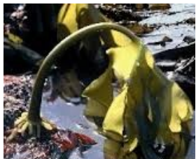
fig1: Goémon de rive

Lichen : Organisme composé (algue et champignon) progressant lentement à la surface des rochers soumis aux marées (fig 2).